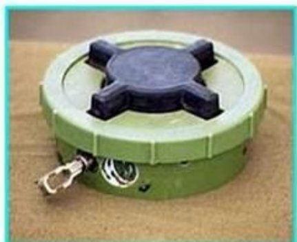
Рис.1 Общий вид мины ПМН-2

ПМН-2 Противопехотная мина нажимного типа