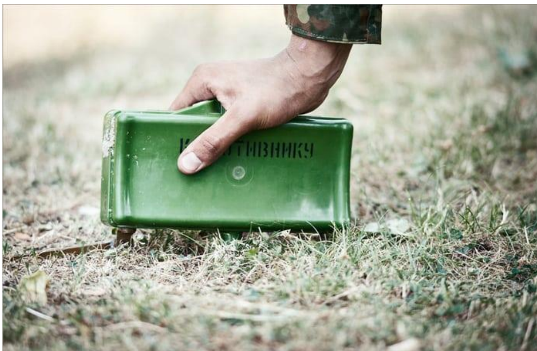
Мина в боевом положении