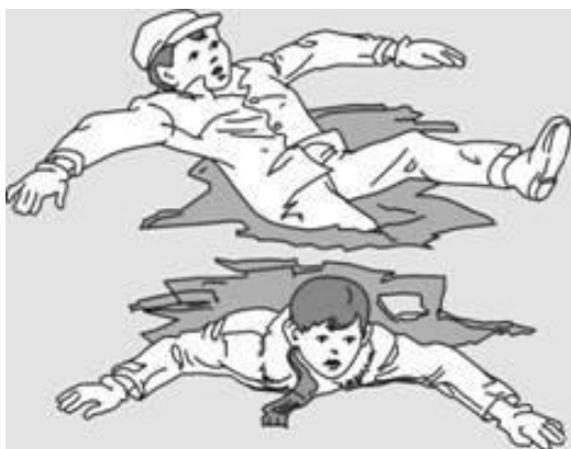
Попытки вылезти самому из полыньи грудью или спиной

Если вы провалились под лед, широко раскиньте руки, навалитесь грудью или спиной на лед и постарайтесь вылезти на него самостоятельно, зовите на помощь.