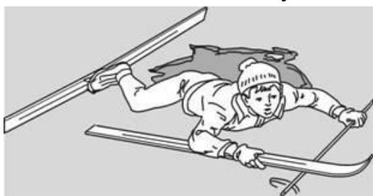
Попытки вылезти самому из полыньи с лыжами

Провалившемуся необходимо внушить, чтобы он широко раскинул руки на льду и ждал помощи, так как самостоятельная попытка вылезти из воды может привести к новому обламыванию кромки льда и очередному погружению пострадавшего под лед.